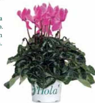
Cyclamen Hola en maceta de 13 cm de diámetro 3,75 €

A lo mejor eres de los que se atreven con las plantas bulbosas. ¿Sabes que ahora es el momento de plantarlas? Ven y te diremos cuáles viven mejor en la zona donde vives.