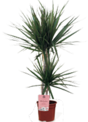
Dracaena marginata en maceta de 17 cm de diámetro 8,60 €