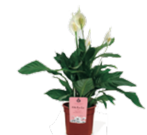
Spathiphyllum en maceta de 17 cm de diámetro 7,95 €