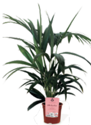
Kentia en maceta de 17 cm de diámetro 24,50 €

“Resistencia y belleza, lo que necesitas de las plantas de tu oficina”