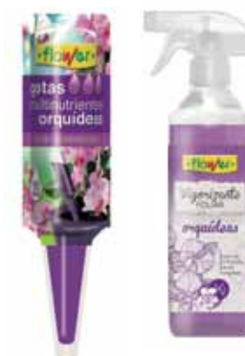
Gotas multinutrientes Flower para orquídeas 1,90 €

Vigorizante foliar Flower para orquídeas en pistola 500 ml 6,90 €