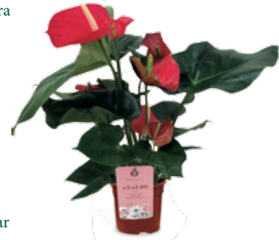
Anthurium en maceta de 17 cm de diámetro 11,95 €