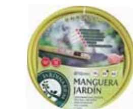
Manguera Jardinarium antitorción con 6 capas de 25 m

Frutal en maceta de 19 cm de diámetro 12,50 €