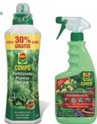
Abono plantas verdes de Compo 1300 ml 6,95 €

Insecticida Efecto Máximo Compo en pistola 750 ml 9,95 €