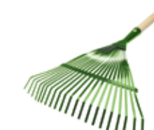
Escoba fija de acero de 21 púas con mango de 130 cm